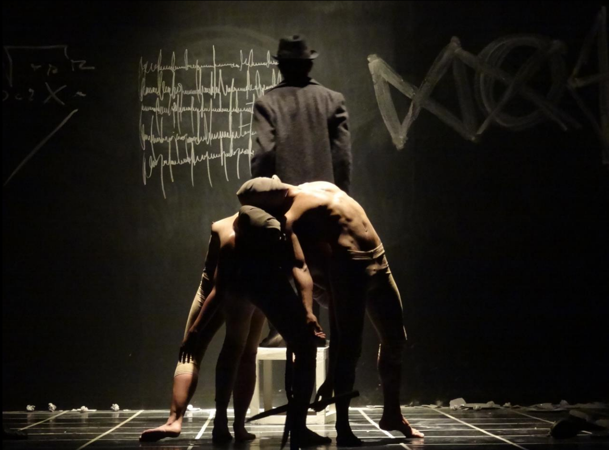
Foto: K. Ramos / "NO+" Dramaturgia.: R. Osorio / Dirección: R. Gaete / Cía ESCENAFISICA. T. N. CHILEN

LUNES / MIERCOLES / JUEVES 19:00 a 22:00