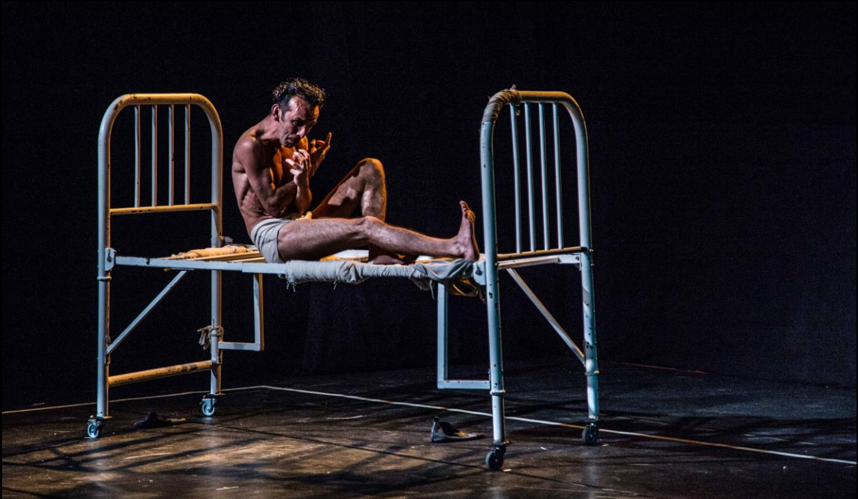
Foto: Leonardo Silva / "LA METAMORFOSIS": F Kafka / R. Gaete / Festival FONTENOVA / PORTUGAL

HORARIO VESPERTINO: LUNES / MARTES / MIERCOLES / JUEVES 19:00 a 22:00